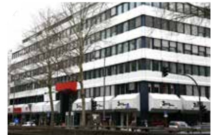
Campus FHM Köln