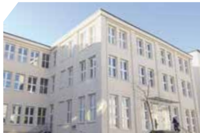
Campus FHM Bielefeld