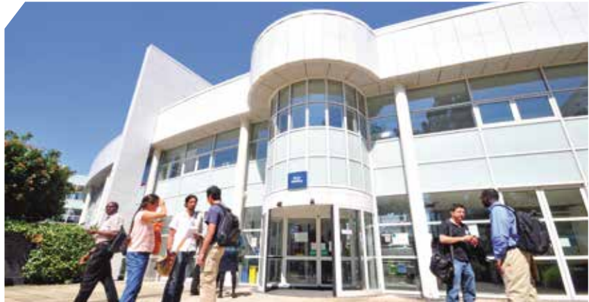
Park Campus Cheltenham

Der Besuch promotionsbegleitender Veranstaltungen auf dem Campus der Business School der University Gloucestershire in Cheltenham ist darüber hinaus möglich. Alle Promotionsstandorte liegen verkehrsgünstig und sind gut mit öffentlichen Verkehrsmitteln (auch vom jeweils nächstgelegenen Flughafen) zu erreichen. Die modernen Seminarräumlichkeiten verfügen über bestmögliche technische Ausstattung und bieten somit ein optimales Lernumfeld.