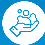
Gründlich waschen mit Seife