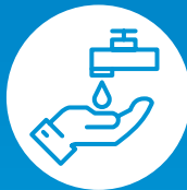
Regelmäßig Hände waschen

Zusätzlich sollten Hände vor und nach dem Veranstaltungsbesuch gewaschen werden.